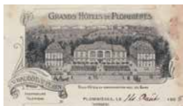
Papier à lettre - 1905.

Dés l'origine, deux bâtiments à vocation hôtelière ont été implantés de part et d'autre des Thermes Napoléon.