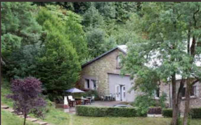
LE PARC TIVOLI