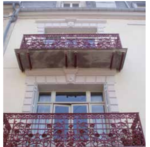
LA VILLE AUX 1000 BALCONS