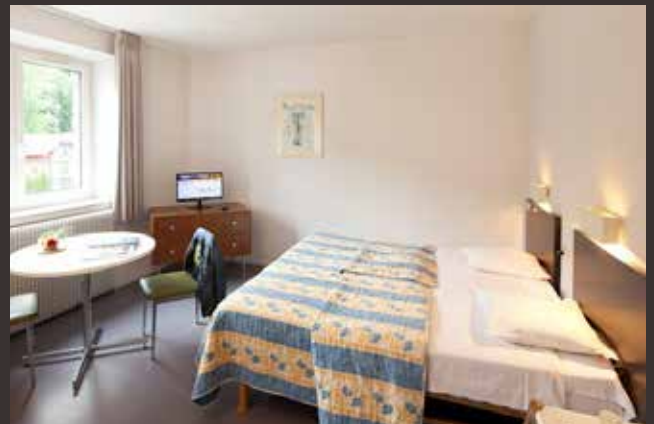
STUDIO AU PARC TIVOLI

Les établissements d'origine ont été conservés puis ré-aménagés en appartements meublés modernes et confortables. Ils sont tous équipés de kitchenettes.