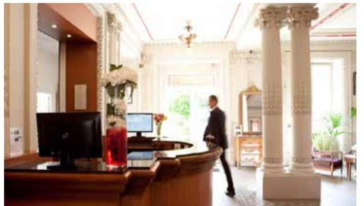
ACCUEIL ET RÉCEPTION