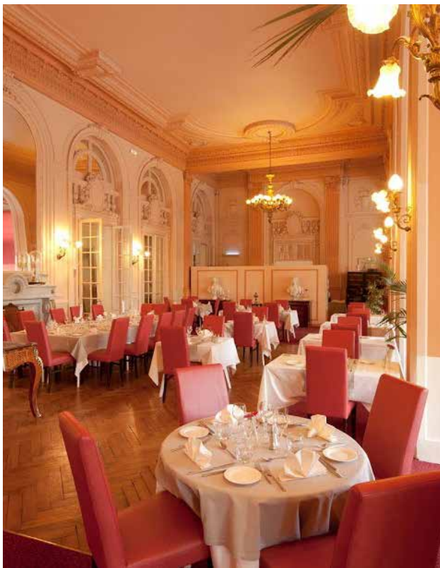
LE RESTAURANT LE JARDIN D'HIVER