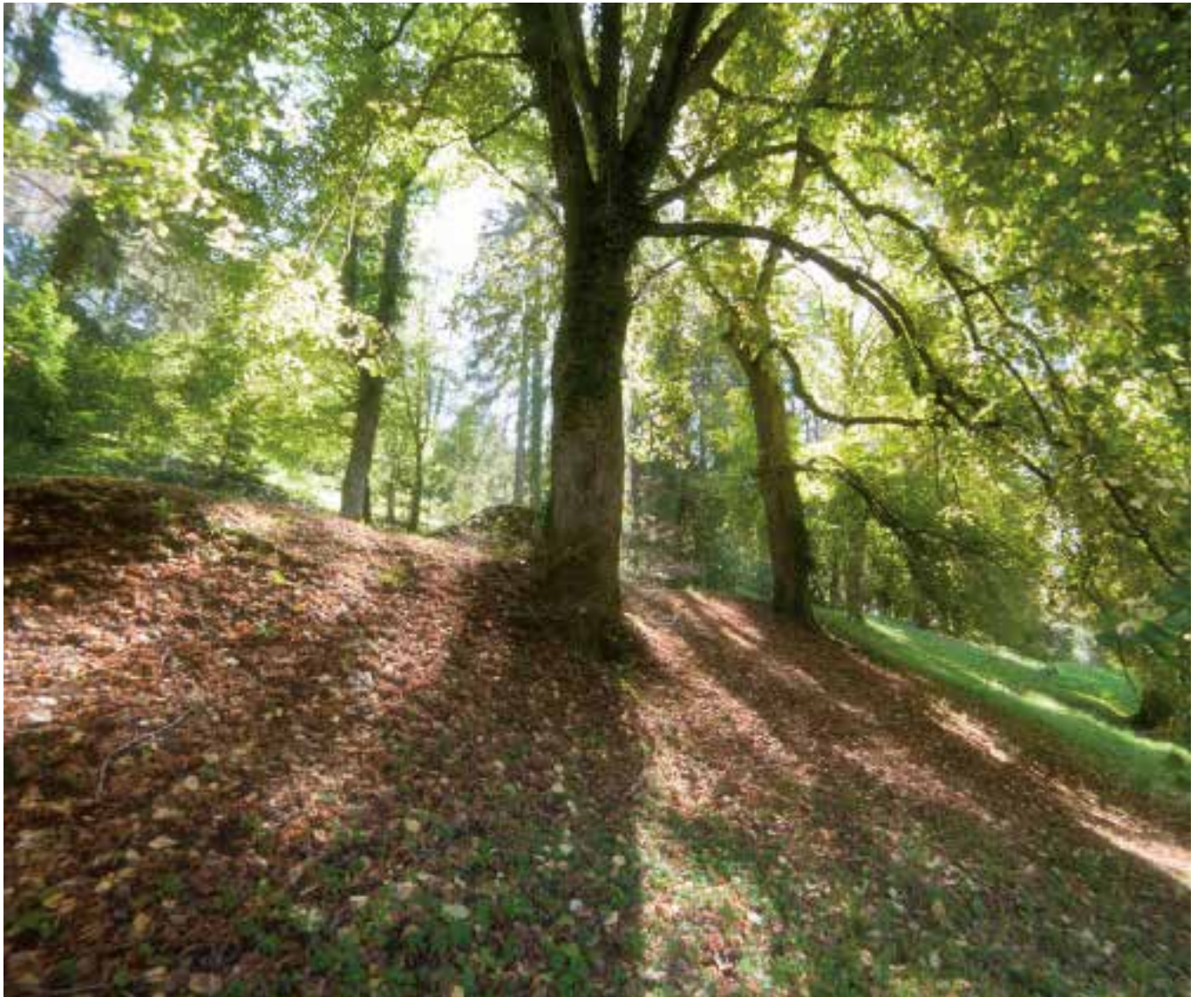
FORÊT DE HÊTRES - PLOMBIÈRES-LES-BAINS