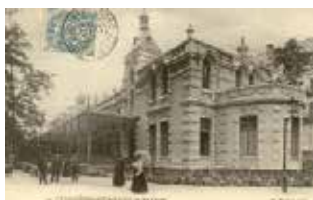
Le Casino, début du XX e .

Le patrimoine culturel de la ville compte également des hôtels particuliers et de belles demeures datant de la fin du XIX e et du début du XX e siècle.