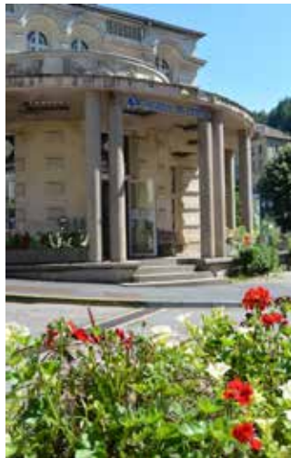
OFFICE DE TOURISME