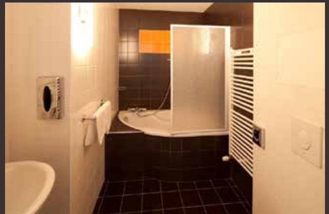
SALLE DE BAIN AU BEAUSÉJOUR