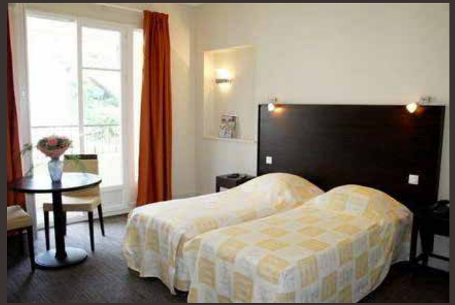
CHAMBRE AU BEAUSÉJOUR